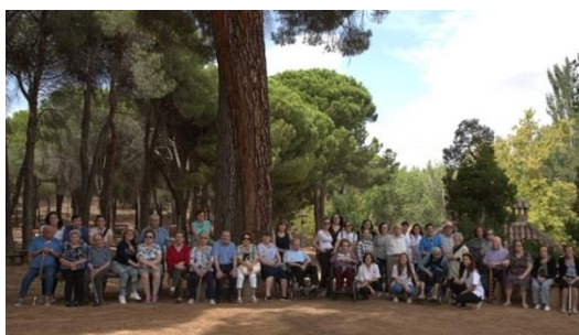
Convivencia en el Valle de los Perales entre usuarios, familiares y trabajadores.