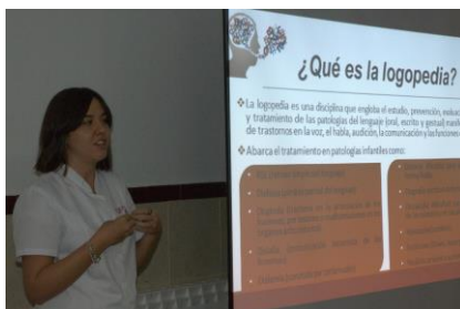
Taller formativo: "Consejos que mejoran la comunicación con los afectados de Alzheimer". Parte I.